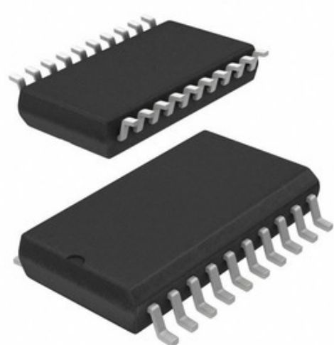
Imagem pode ser representação. Veja as especificações para detalhes do produto.